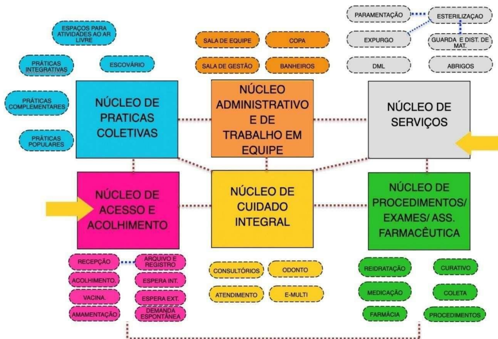
Figura 1: Diagrama de Massas