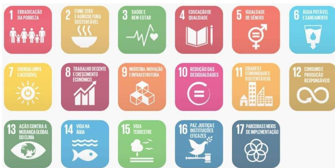
Figura 02: Objetivos de Desenvolvimento Sustentável